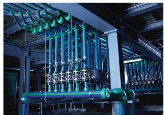
Vorgefertigter Verteiler aus aquatherm blue pipe für eine Indus-trieanwendung.