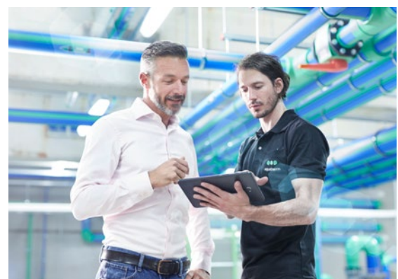
aquatherm plant und baut Verteiler und Sonderbauteile direkt im eigenen Werk, komplett nach Kundenvorgaben, und versendet diese einbaufertig an jeden beliebigen Ort dieser Welt.