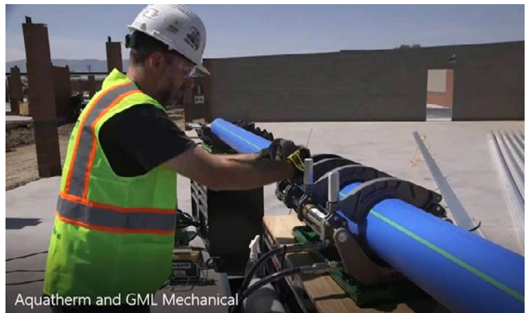
Aquatherm and GML Mechanical

http://www.aquatherm-pipesystems.com/Aquatherm-and-GML-Mechanical.mp4