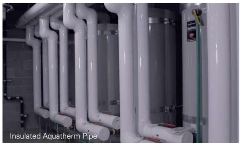
Insulated Aquatherm Pipe